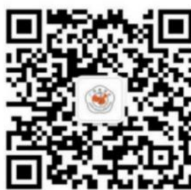
广西医学会公众号