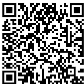
广西医学会男科学2026年学术年会 报名二维码