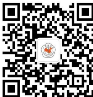
欢迎关注广西医学会微信公众号