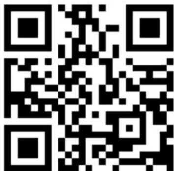
儿科学分会 2020 年 学术年会报名二维码

（五）通知可登录广西医学会网站www.gxma.org.cn或关注广西医学会微信公众号（guangxiyxh）查询及下载。